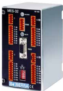
MES-32 ROZŠIROVACÍ MODUL