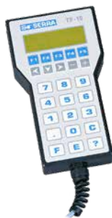
PRENOSNÝ PROGRAMOVACÍ TERMINÁL TP-10